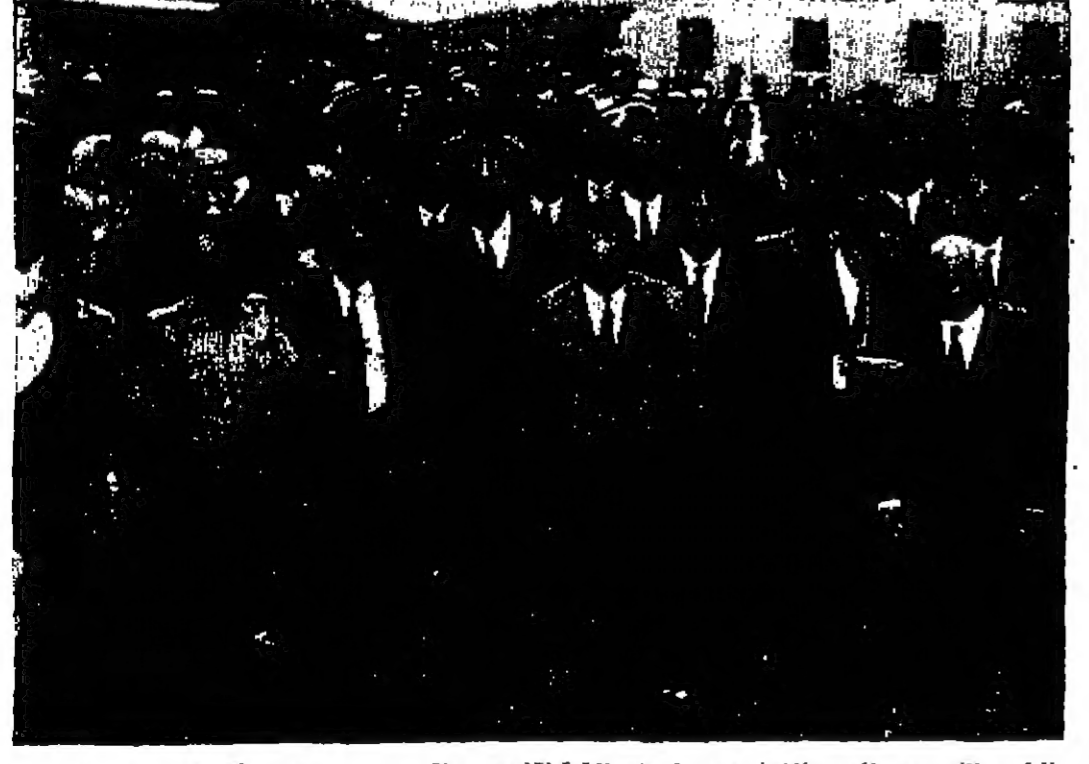
الرئيس الليبي عبد الحميد الكوش يتناول في مخيم القنبلة للتاريخ برفقة عدد من الوزراء الاردنيين مساء امس